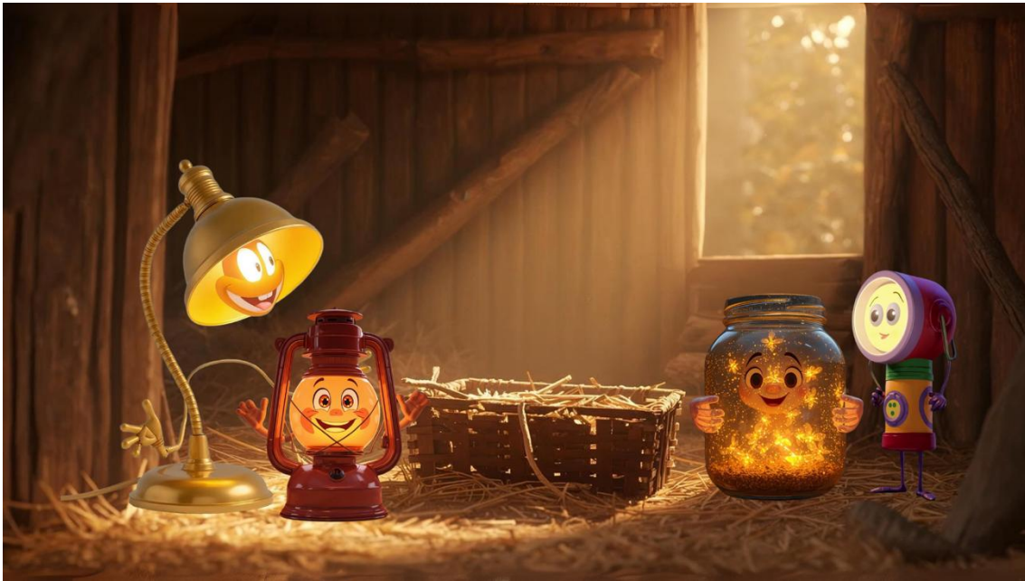
Ilustración 1. Idea de cómo puede quedar el mural.